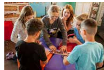
Wohnen und Familie