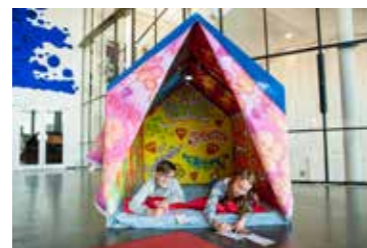
Träume und Engagement